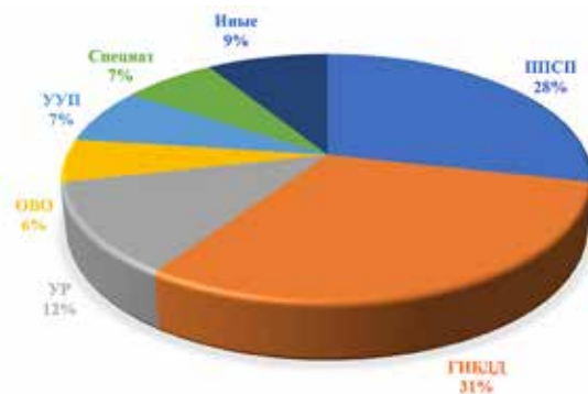
Рис. 1. Применение огнестрельного оружия службами (2014–2019 гг.)

меняющие огнестрельное оружие, в связи с чем, в основном, опрошены представители именно этих подразделений (рис. 1).