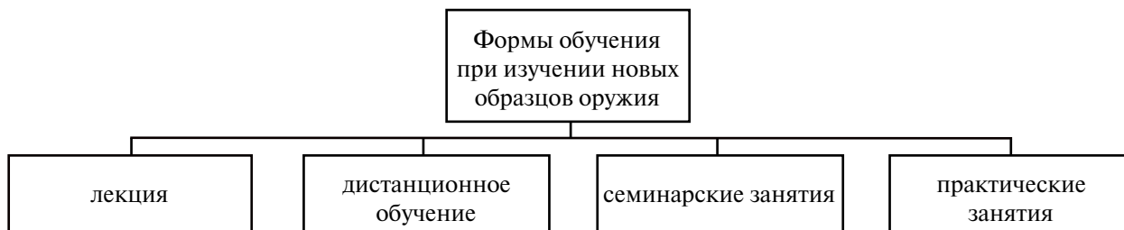
Рис. 2. Формы обучения при изучении новых образцов оружия

Изучение организуется руководителем территориального органа МВД России [2] при поступлении новых образцов оружия (рис. 2).